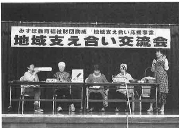
☆保健協力員による活動報告