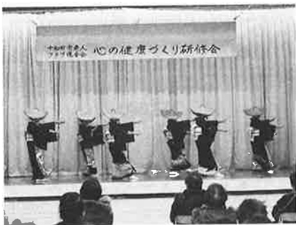
☆あかしや会の皆さん