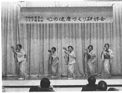
☆みどり会の皆さん