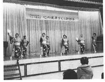
☆茂久蓉会の皆さん