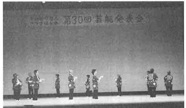
♪東小稲寿会 「炭坑節」