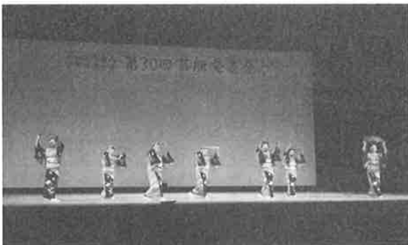
♪茂久蓉会 「伊達しぐれ」