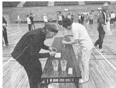
☆「まめに働け」競技のようす