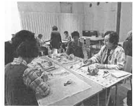
☆「飾り傘」をつくるようす