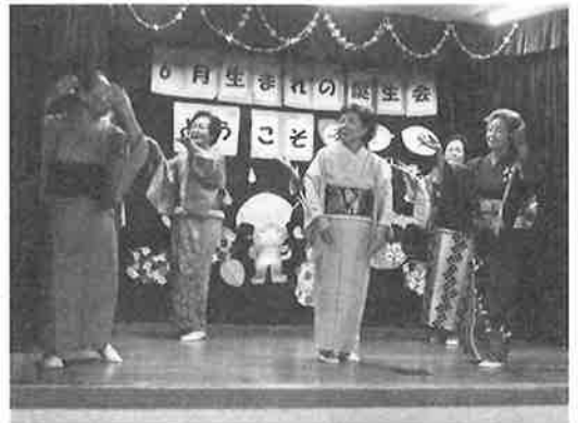
♪みどり会のみなさん