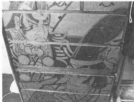
☆一貫張りのバックとダンス

一貫張りとは、古いザルやカゴに和紙をはり、その上に布をはりつけ、最後に柿渋をぬり仕上げた物です。昔の人々は物を大事にしていた様で使えなくなつた物を、またどうにかして活かして再利用する。私も微力ではございますが、これからも先人達に学び多くの物の「リメイク」を楽しんで行きたいと思っております。