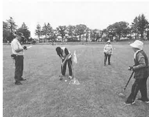
☆ねらって、ねらって～