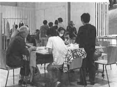
☆体験コーナーにたくさんの方が来てくれました♪