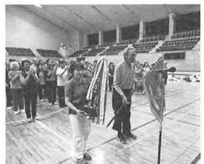
☆優勝おめでとうございます☆