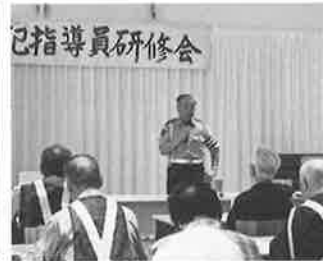
☆十和田警察署 宇部交通課長さん ありがとうございました。

れました。日頃からの疑問点や免許を 返納したいが出来ない事情等につい ての意見もありました。また、今年4月 19日に発生した高齢運転者による死 亡事故で亡くなられた遺族からのメッ セージも紹介されました。結びにパネ ラー達からの助言を頂き終了しました。