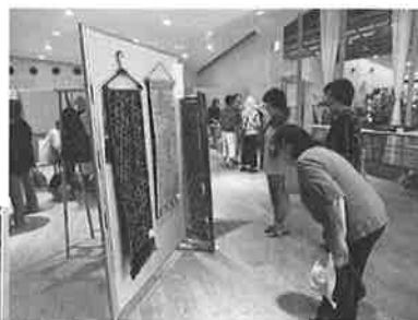
☆どの作品もステキでした☆

8月24日10時、市老連恒例の手づくり作品フェアを、市民交流プラザトワールで開催。来場者106名、出品作品158点、また、今までにない大物の絵カゴ、着物のアレンジ、パッチワークのクッション、桜の写真等、会員の努力の作品とカラフルな傘が所狭しと展示され、傘作りにたくさんの方が参加されました。作品を見学においでにな