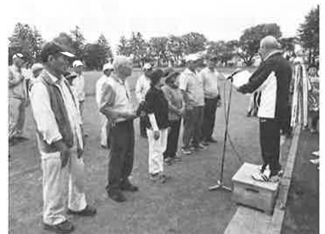
☆優勝のさわやかクラブAのみなさん