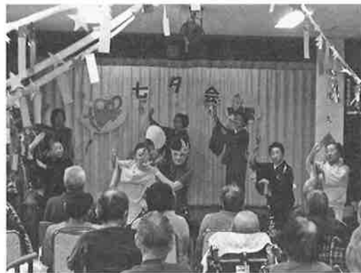
♪茂久蓉会のみなさん