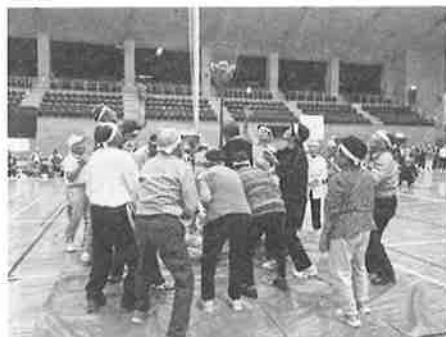
☆「玉早入れ」競技のようす