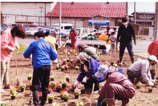
三世代で協力した「花いっぱい運動」

葛野長寿会・町内会・子供会が合同で葛野交差点前にある花壇の花いっぱい運動に参加しました。令和4年5月15日(日)朝8時集合です。