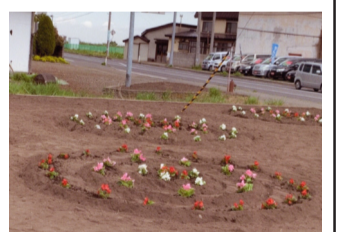
みんなの協力で出来た花壇