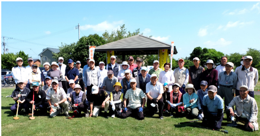
令和4年度 老連会長杯グラウンド・ゴルフ大会 2022.6.18