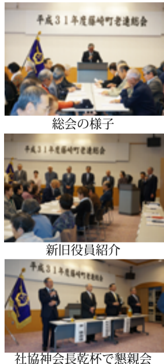
社協神会長乾杯で懇親会