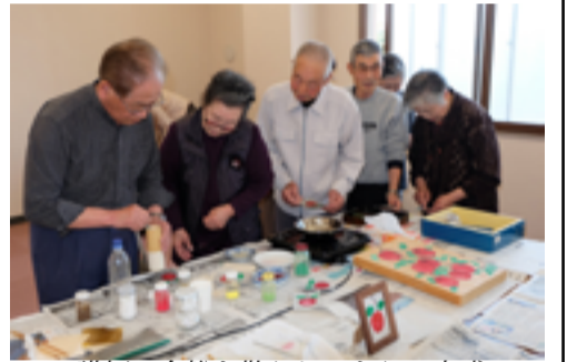
講師に金粉を散らしてもらい完成