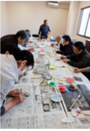
完成間近の制作風景

塗っては乾かし、これをひたすら繰り返し、色の濃さを調整する。納得いくまでの努力が必要。