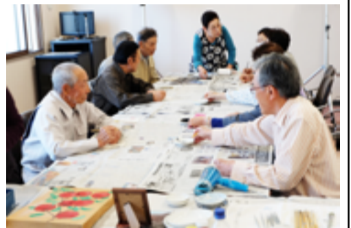
お互いの作業状況を比較しながら

塗っては乾かし、これをひたすら繰り返し、色の濃さを調整する。納得いくまでの努力が必要。