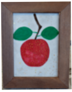
今回のテーマ講師の参考作品

(7)りんごの光る部分に赤色を塗る。(8)りんごの表面に黄色で細かい点をランダムに着ける。(9)膠液を金粉を散らす部分に塗る。(10)金粉を振り散らす。