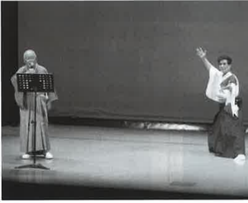
是川・柏崎地区「アイヤ子守唄」