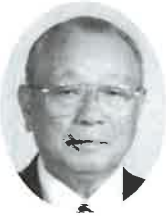
八戸市老人クラブ連合会