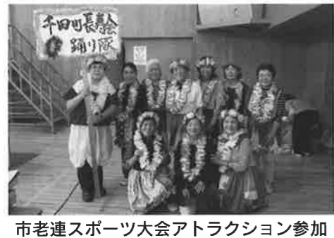
市老連スポーツ大会アトラクション参加