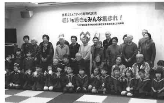
R1.11.8. 世代交流事業(光星学院高校)