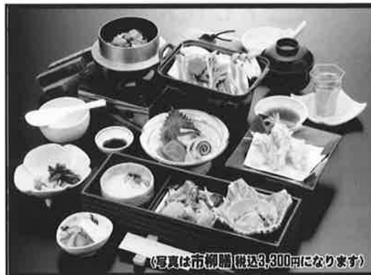
(写真は市柳膳 税込3,300円になります)

八戸市吹上一丁目15-90 TEL.0178-43-1111 http://www.Hachinohe-park.com