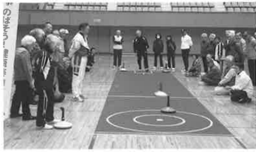
R1.10.29. ユニカール講習会