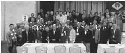
R1.7.11~12. 東北ブロックリーダー研修会(盛岡市)