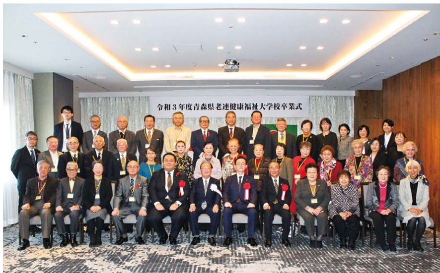
令和3年12月3日(金) 於：青森市「アートホテル青森」

今年度の卒業生は、青森市30名、おいらせ町14名、合計44名です。これまでの卒業生と合わせると、1,305名になります。卒業後は、地域のリーダーとして市町村老連会長、副会長、女性部長等で活躍しているのはもちろん、それぞれの地区でOB会や同期会を設立しています。また、地域の集いの場の開催や所属老連事務局の運営協力など様々なところで活躍しています。