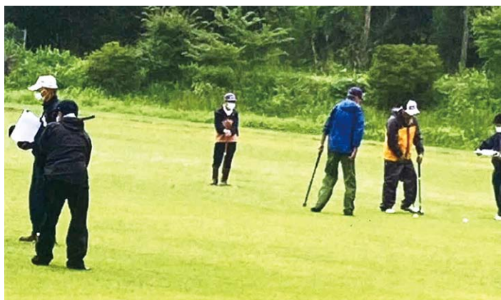
新郷村 川代老人クラブ「グラウンド・ゴルフ」