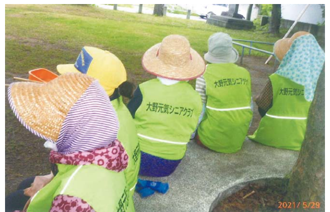
ベストを着用しての清掃活動