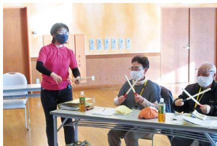
～音楽で楽しい時間を～