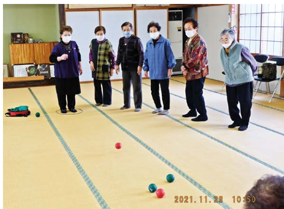
藤崎町 中野目長寿会「ペタンク」

この事業は、全国老人クラブ連合会を通して、みずほ教育福祉財団から助成を受けて実施しています。今年度は、藤崎町、西目屋村、新郷村の3つの老連です。活動の目的は、住みなれた地域で自分らしい暮らしを継続する事業を応援しています。老人クラブがこれまで取り組んできた友愛活動につながる活動を支援しています。過去に事業を受けた市町村老連では、その後、行政から支援を受けて活動を継続している市町村老連があります。