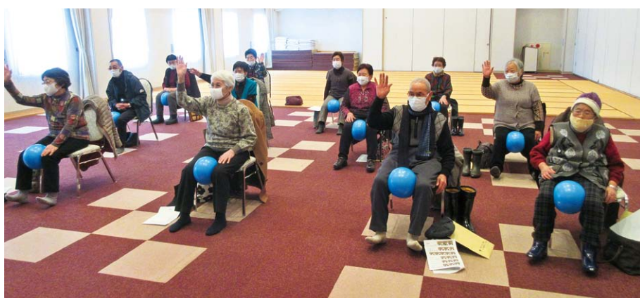
西目屋村「元気づくり教室」