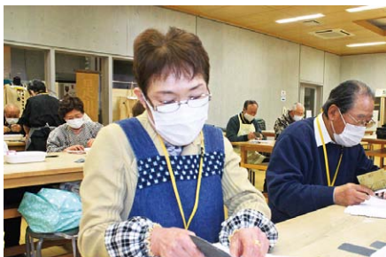
体験学習「勾玉作り」