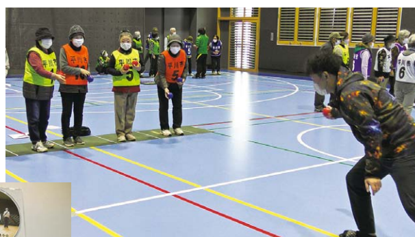
ニュースポーツ講習会「ボッチャ」