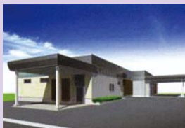
サイレントルーム入口

故人様のそばでゆっくりお過ごしいただける安置室をご用意いたします。専用の出入口を設けるなど、細やかな配慮をさせていただきます。また病院から直接お入りいただく事も可能です。