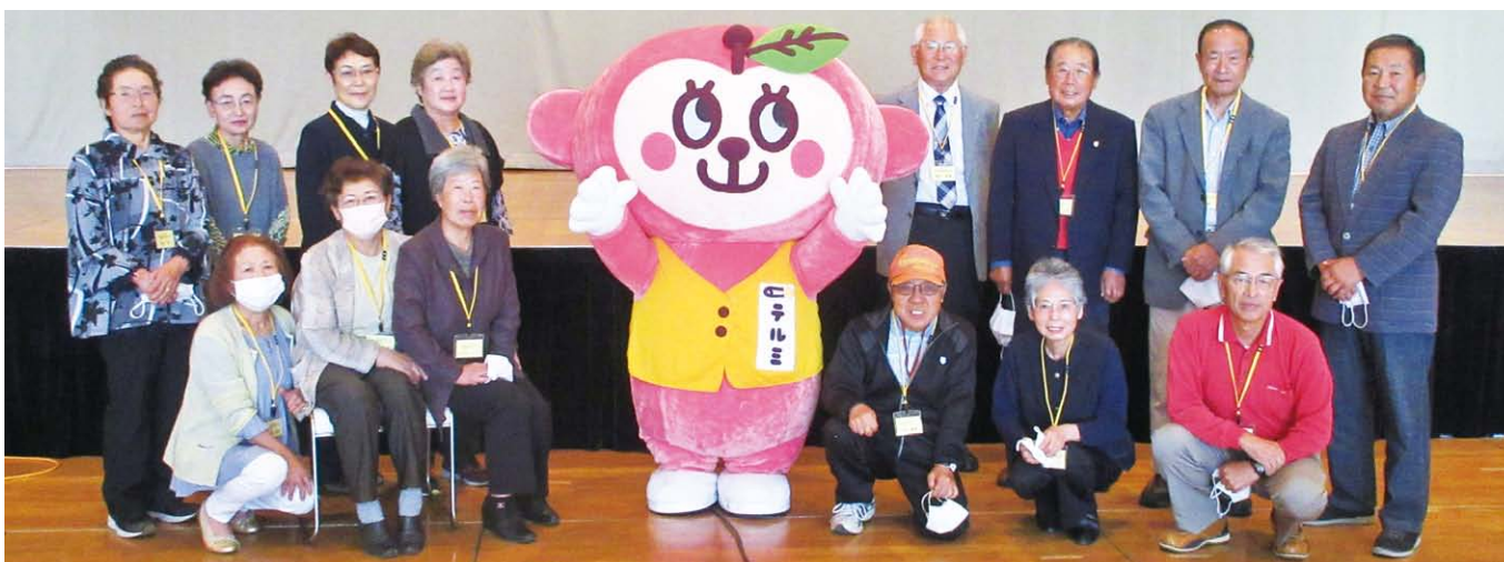
講義「かしこい消費者になろう～消費者トラブルを防ぐためには～」 中央：消費生活センター キャラクター「テルミ」ちゃん