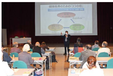
お薬と賢く付き合しましょう