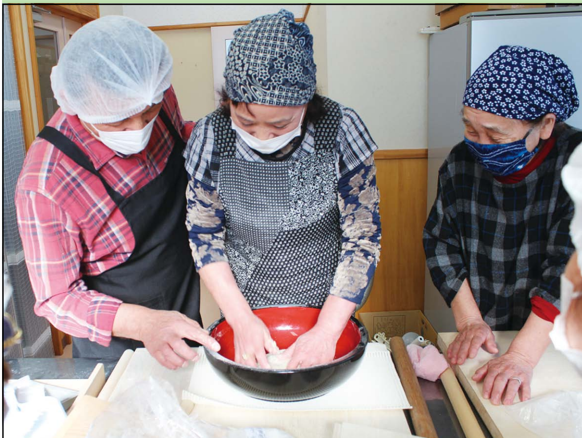
担い手育成事業 三沢市 前平老人クラブ「そば打ち」

令和4年3月24日 公益財団法人青森県 老人クラブ連合会 青森市中央三丁目 20番30号 電話 017-732-6492