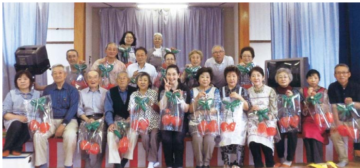
バルーン教室 (サクランボ)