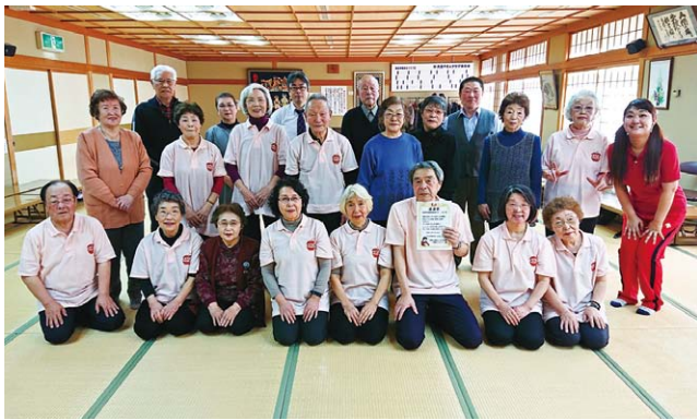
NHKあっぷるワイドで放映