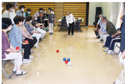
ニュースポーツ「ボッチャ」