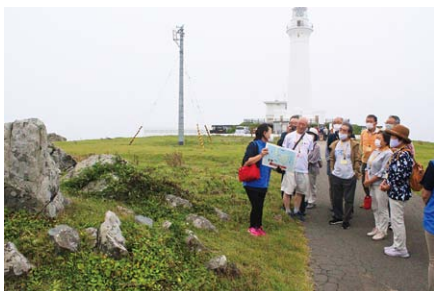
ジオパークの名所をめぐる