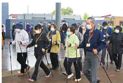
ノルディック・ウォーキング