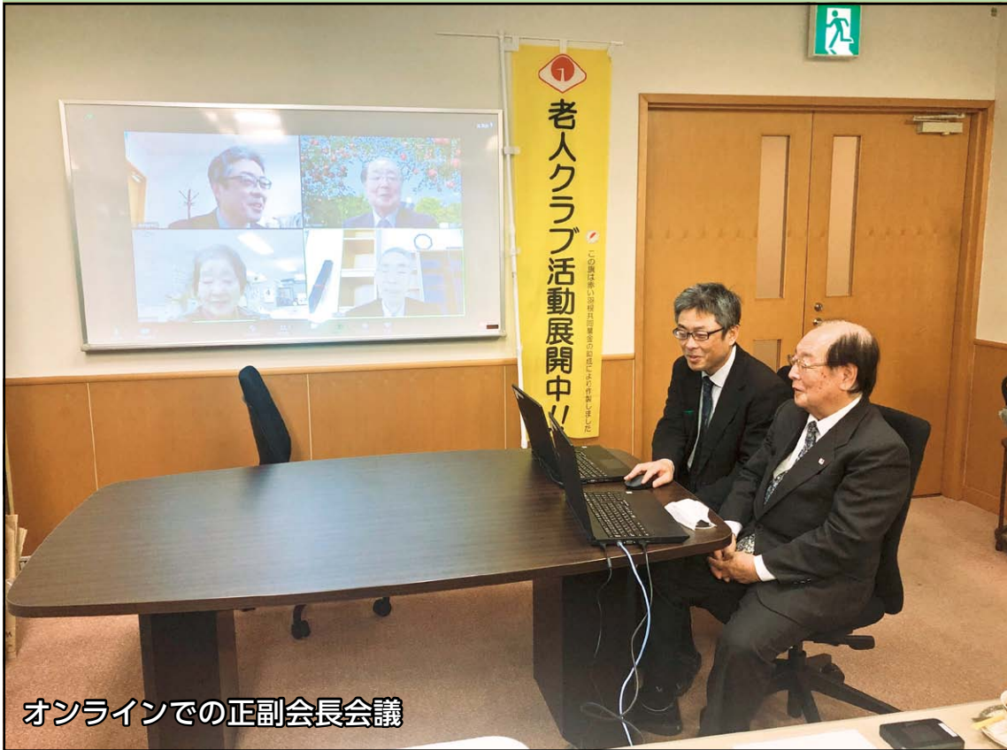
オンラインでの正副会長会議

令和3年3月26日 公益財団法人青森県 老人クラブ連合会 青森市中央三丁目 20番30号 電話 017-732-6492