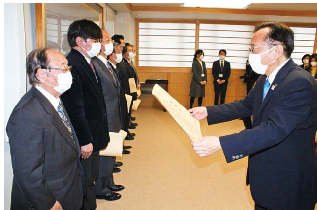
左：齋藤会長 右：三村県知事

令和3年1月8日（金）青森県運転免許センター3階 視聴覚室において村井紀之青森県警察本部長から、また令和3年2月4日（木）青森県庁において三村申吾青森県知事から、県内の交通死亡事故が現行統計史上最少の28名となり、活動の功労に対して感謝状が贈呈されました。（他9団体が贈呈） 当連合会では、機関紙や研修会等で交通安全の呼びかけを行っており、今後も交通安全の運動を推進していきたいと思っております。