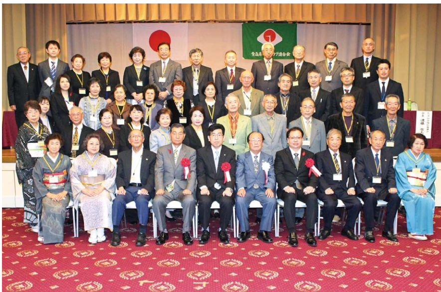
令和2年11月20日(金) 於：むつ市「プラザホテルむつ」

今年度の卒業生は、むつ市35名、五所川原市27名、合計62名です。これまでの卒業生と合わせると、1,261名になります。卒業後は、地域のリーダーとして市町村老連会長、副会長、女性部長等で活躍しているのはもちろん、それぞれの地区でOB会や同期会を設立しています。また、地域の集いの場の開催や所属老連事務局の運営協力など様々なところで活躍しています。