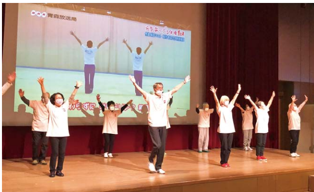
元気あっぷる体操の練習