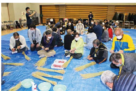
しめ縄(としな)作り