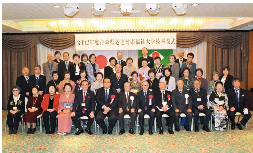
令和2年度青森県老連健康福祉大学校卒業式