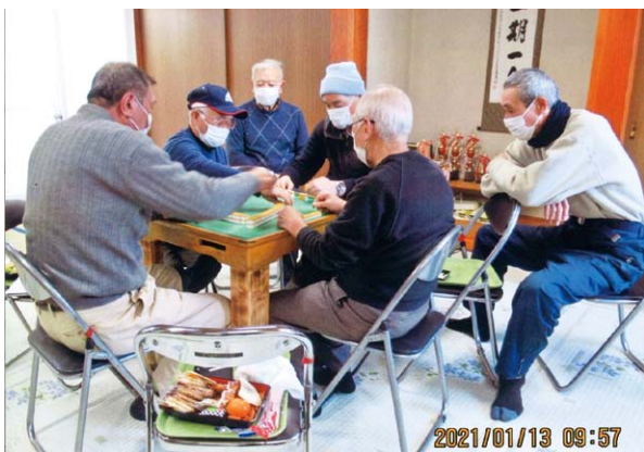
マージャンクラブ