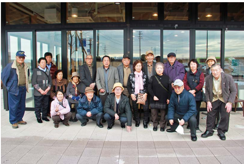
田子町老連幹部研修旅行 道の駅「平泉」にて

最後になりますが、今年度このようなコロナ禍の中で、老人クラブ会員のような要配慮者、集団行動の自粛など、活動を行う上で大きな障害が伴う一年間となりましたが、各単位クラブ、各会員一丸となつてこの危機を乗り越え、老人クラブの更なる発展につながっていくことを期待しています。