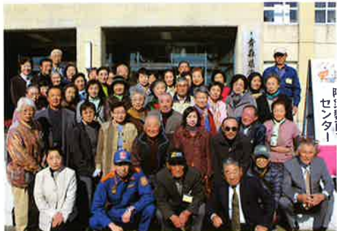
施設見学「青森県消防学校」