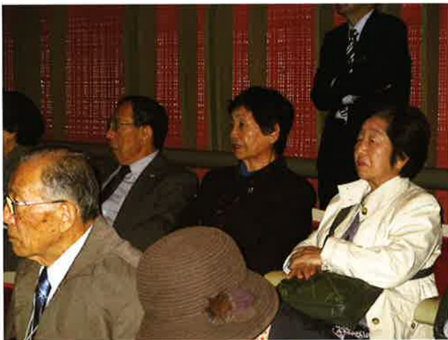
活動交流部会風景