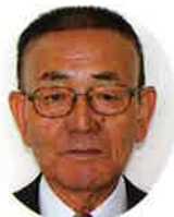
鶴田町老人クラブ 連合会