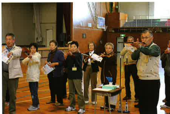
ニュースポーツ (吹き矢)