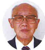
青森県老人クラブ連合会