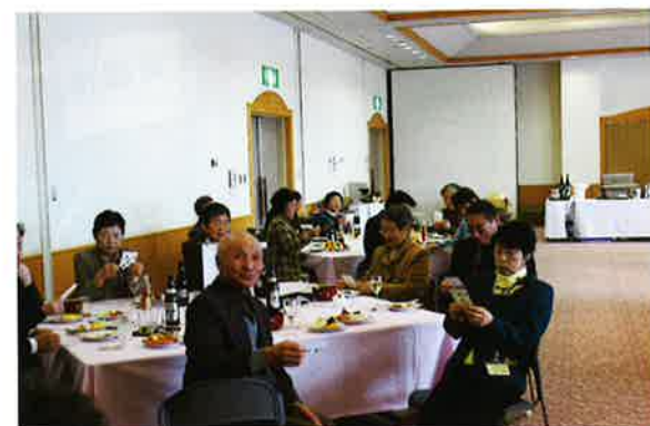
卒業記念パーティー