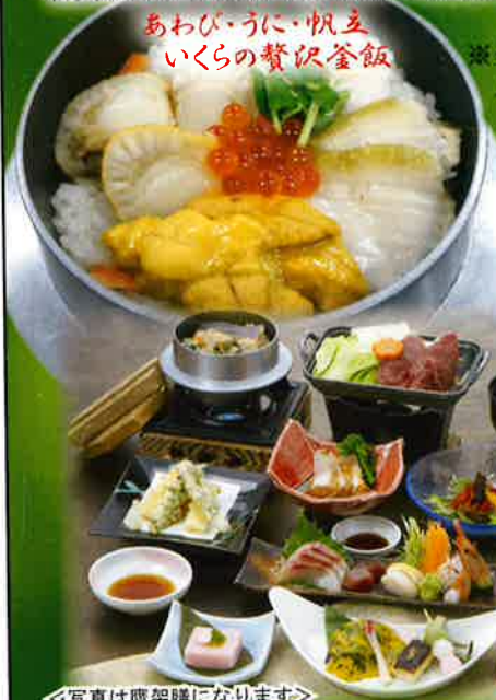
あわび・うに・帆立 いくらのお祝い釜飯

※全プラン10名様以上からのご予約制となります。《六ヶ所原燃PRセンター見学付》 入館料・室料・税込価格