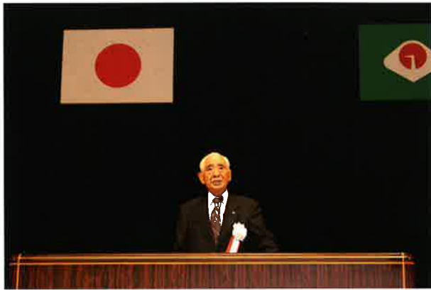
主催者あいさつ 今本会長

芸能発表大会は、平成16年より開催しており、年々、出演する方々のレベルが高くなっているように思われます。