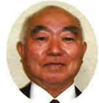
西十一番町和交会 (十和田市)